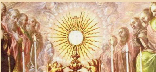
Corpus Christi Procession Procesión del Corpus Christi,

Nuestra querida Arquidiócesis está en necesidad. Tenemos escasez de sacerdotes para guiar al pueblo de Dios, escuchar sus confesiones y dar la absolución, dar consuelo a los enfermos y moribundos, y celebrar la liturgia de la Misa. Por favor, ¡oren por más sacerdotes y por aquellos con quienes Dios nos ha bendecido!